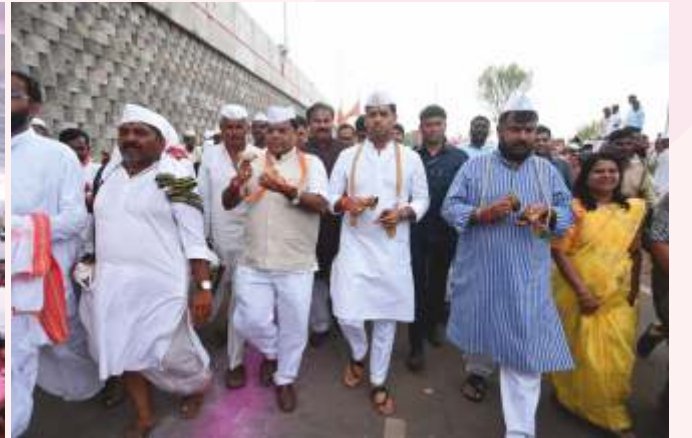
पालखी सोहळ्यामध्ये वारकऱ्यांसमवेत सहभागी झालेले आरोग्य मंत्री मा. ना. प्रा. डॉ. तानाजी सावंत व खा. डॉ. श्रीकांत शिंदे