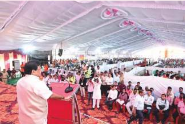
महाआरोग्य शिबिरामध्ये मार्गदर्शन करताना आरोग्य मंत्री मा. ना. प्रा. डॉ. तानाजी सावंत.

मुख्यमंत्री एकनाथ शिंदे यांनी शिबिराला भेट देऊन रुग्णांना पुरविण्यात येणाऱ्या आरोग्य सेवांची माहिती घेतली व रुग्णांशी, डॉक्टर, कर्मचारी यांच्याशी संवाद साधला. रुग्णांना पुरवण्यात येणाऱ्या आरोग्य सेवांची त्यांनी प्रशंसा केली व उत्कृष्ट नियोजनाबद्दल आरोग्य मंत्री डॉ. तानाजी सावंत यांचे कौतुक केले. सामान्य माणूस केंद्राबिंदू मानून सरकार आरोग्यासाठी विविध योजना राबवित आहे. याचा सामान्य माणसाला फायदा होईल, असा विश्वासही त्यांनी व्यक्त केला.