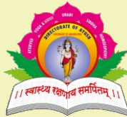
आयुष संचालनालय महाराष्ट्र राज्य