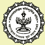
महाराष्ट्र शासन वैद्यकीय शिक्षण व औषधी द्रव्ये विभाग

(उपरोक्त सर्व औषधे तज्ञ आयुर्वेदिक व होमिओपॅथीक डॉक्टरांच्या सल्यानंतरच घ्यावीत)